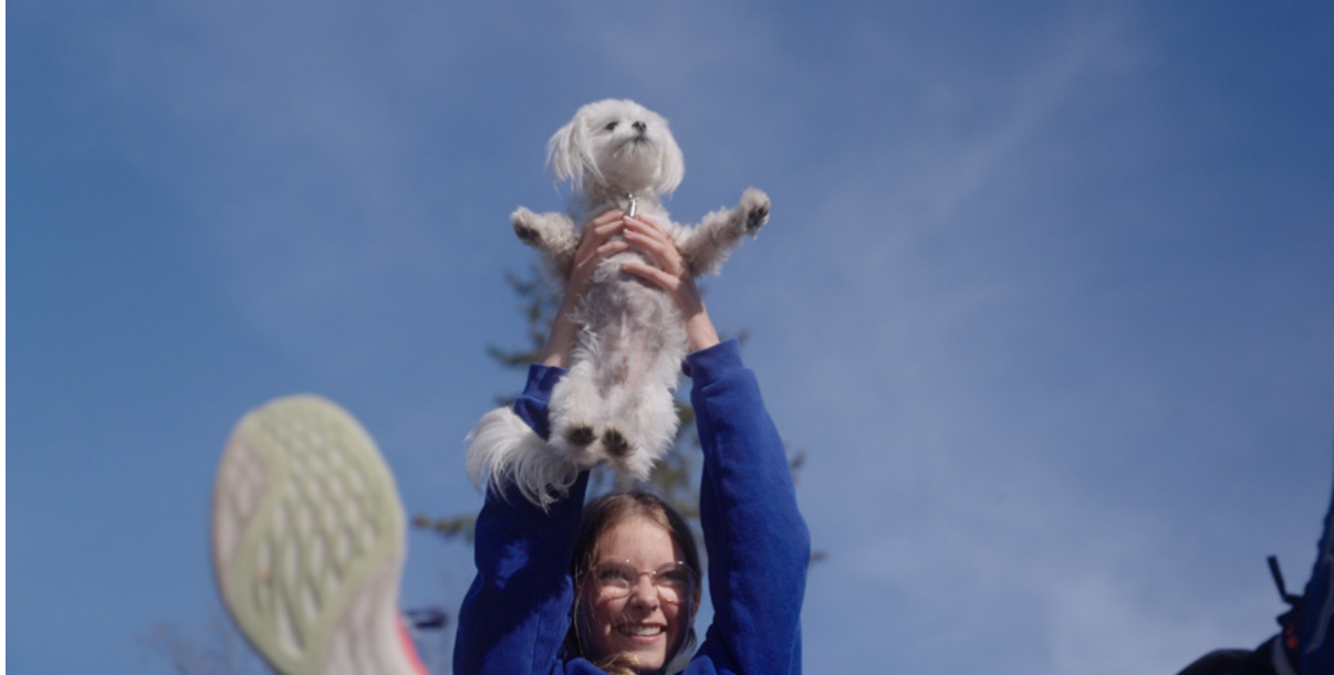
Fra kinodokumentaren «Salto, Pus og den døde fisken» som produseres av LØV Film.