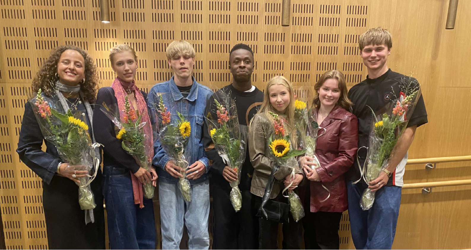
Skuespillere fra serien «Solo», som vises på Amazon Prime. Produsert av Rubicon TV og Smallville Films.