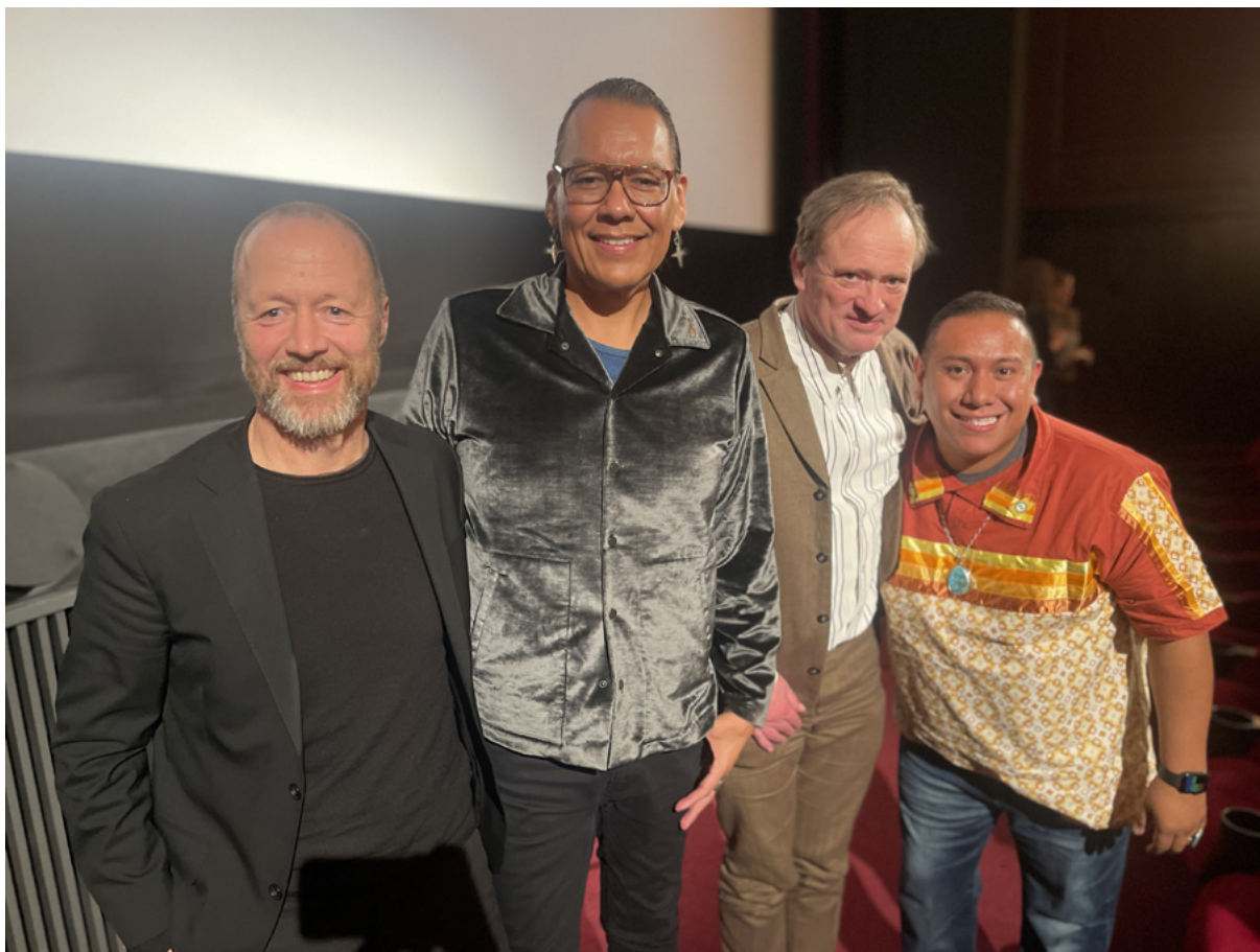
Fra verdenspremieren av «Geronimos tapte stamme» i hovedkonkurransen på CPH:DOX