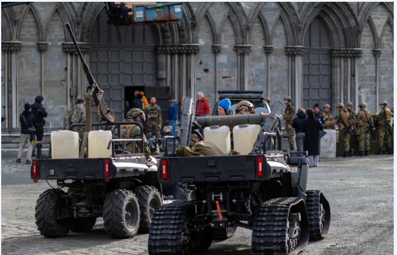
Fra innspilling av filmen «Troll 2» i Trondheim. Filmen produseres av Motion Blur for Netflix.

Dette er en omsetningsøkning på 96% fra konsolideringen av fondene i 2016. 42% for film og 332% for spill. Halvparten av selskapene både innenfor film og spill kan vise til positivt årsresultat. Filminvest har i perioden 2016-2024 bidratt i 79 realiserte prosjekter med et estimert forbruk i regionen på ca. 800 millioner.