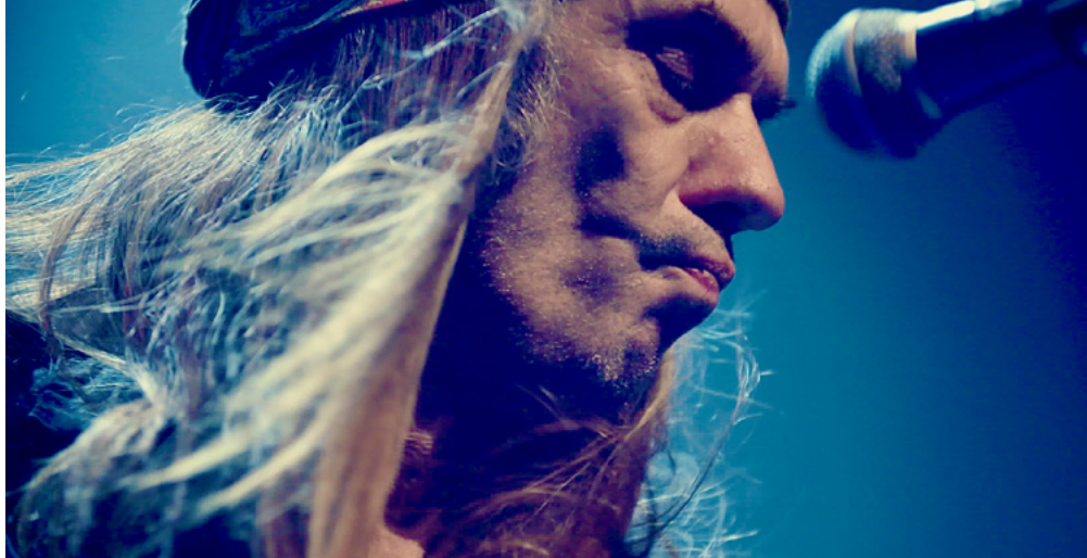
Bilde fra kinodokumentaren «Blod i sporene» som utvikles av Dag Hoel Filmproduksjon.